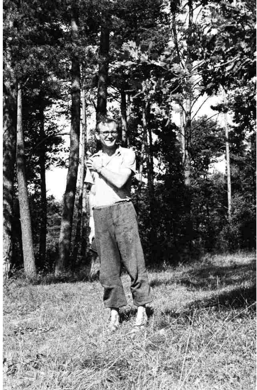
padre Karol Wojtyła