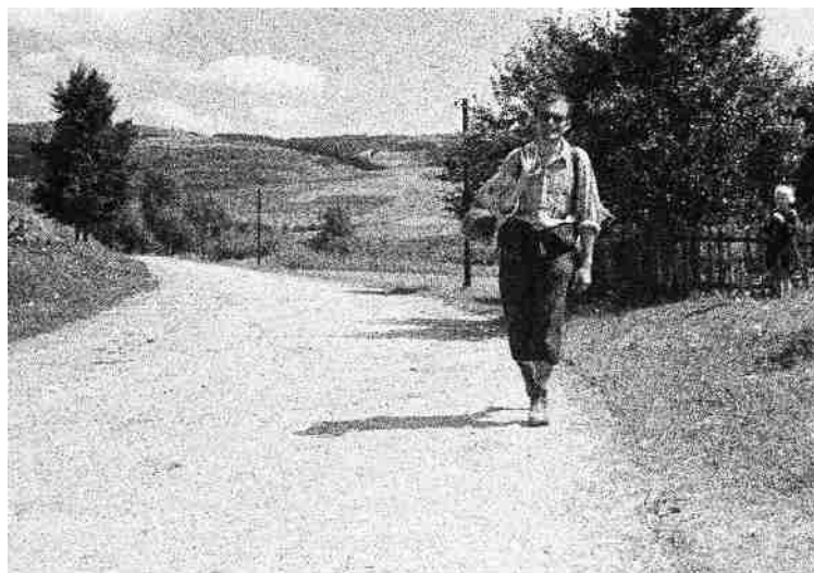
padre Karol Wojtyła