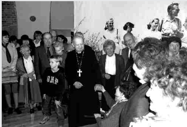
Inauguração da exposição no Museu Nacional em Cracóvia, 10.11.2006