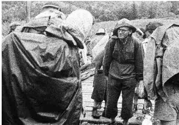
quinto a contar da esquerda padre Karol Wojtyła